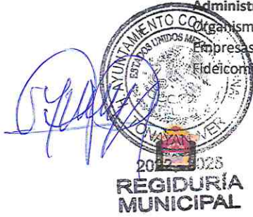
MUNICIPIO DE TONAYAN, DEL ESTADO DE VERACRUZ DE IGNACIO DE LA LLAVE ORGANIGRAMA